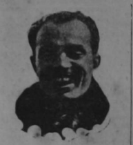
Cap. Arturo Ferrarin.

DESCENDIERON AYER A LAS 5.50 P. M. 10 MILLAS AL N. DE NATAL, DE DONDE SIGUIERON PARA RIO DE JANEIRO