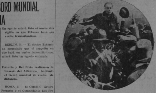
El Capitán Arturo Ferrarin llevado en triunfo después de haber alcanzado el record mundial de duración en el aire, 59 1/2 horas de vuelo continuo.

ROMA, 5. — El Capitán Arturo Ferrarin y el Comandante Del Prete, que salieron el martes 6 de esta ciudad, pasaron sobre la costa de Brasil hoy, según informan de Port - Natal, que está a una distancia de cuatro mil ochocientos cincuenta millas de Roma, batiendo así el record mundial de vuelos de distancia, que pertenecía a Chamberlin y Levine, que volaron tres mil novecientos cinco millas de Nueva York a Alemania el año pasado.